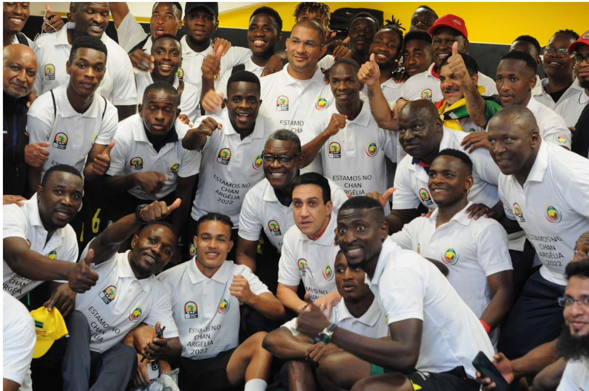
Seleção Nacional de Futebol - Mambas comemora qualificação para o CHAN Argélia 2022