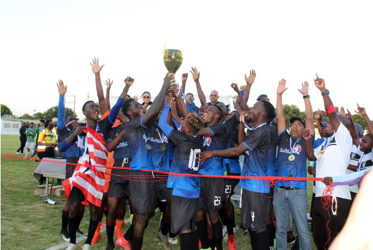
Associação Black Bulls comemorando a conquista da Supertaça Mário Esteves Coluna 2022