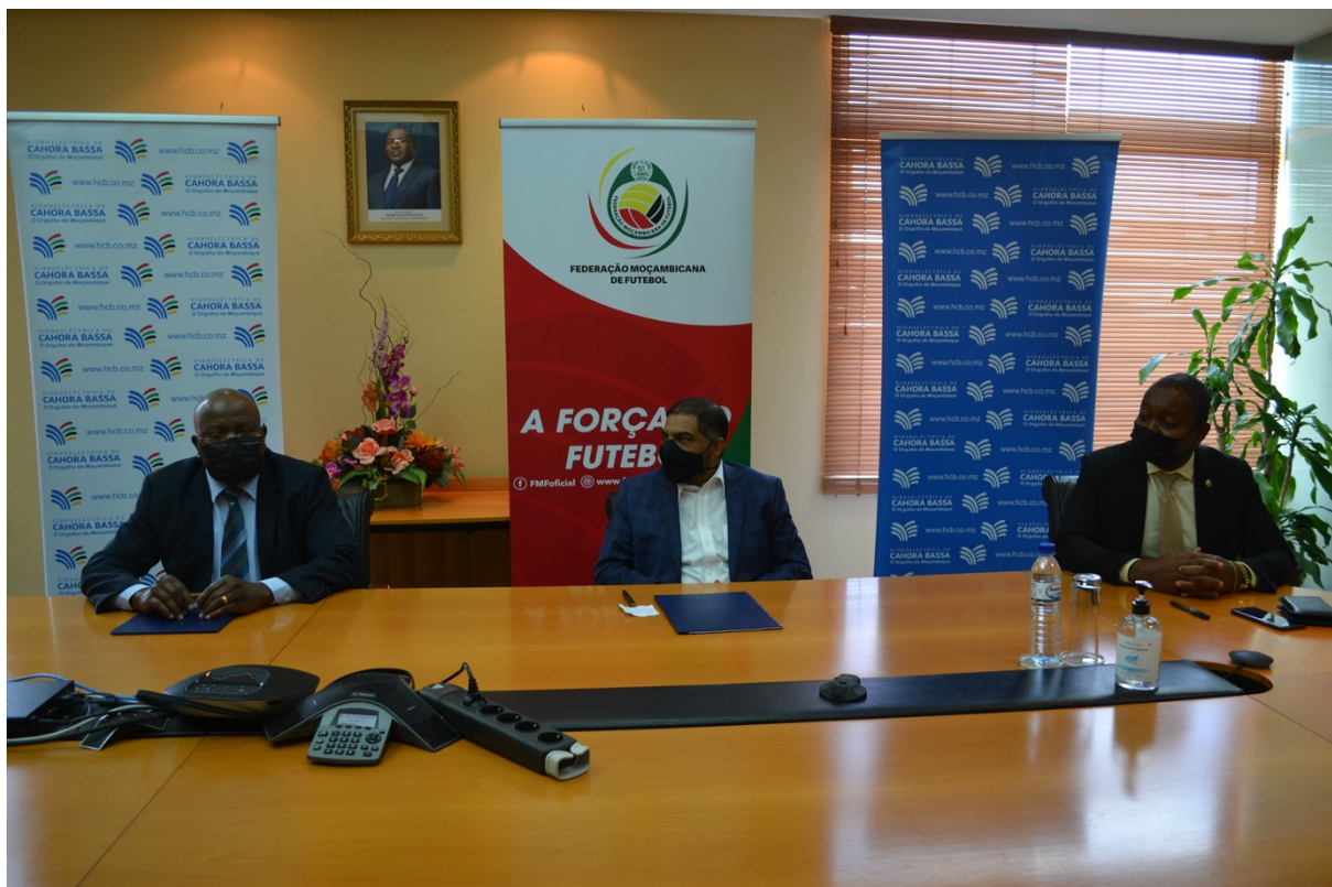
Cerimónia de renovação do acordo de parceria entre a FMF e a Hidroeléctrica de Cahora Bassa