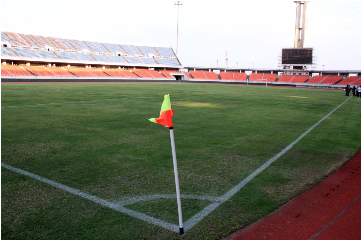
Vista do relvado do Estádio Nacional do Zimpeto, numa visita de inspecção rotineira