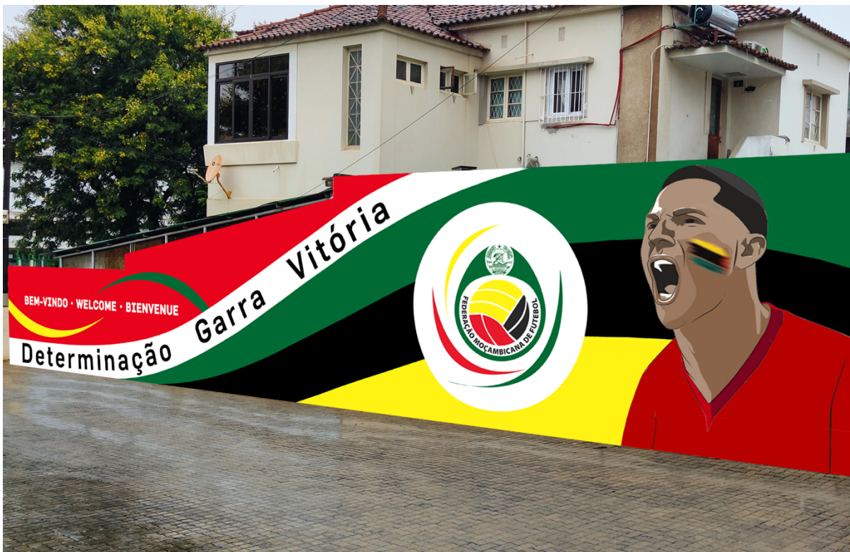
Mural Artístico na sede da Federação Moçambicana de Futebol