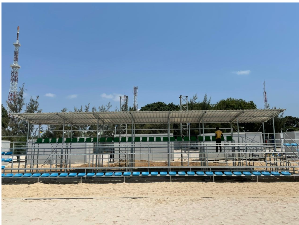
Arena de Vilankulo em construção